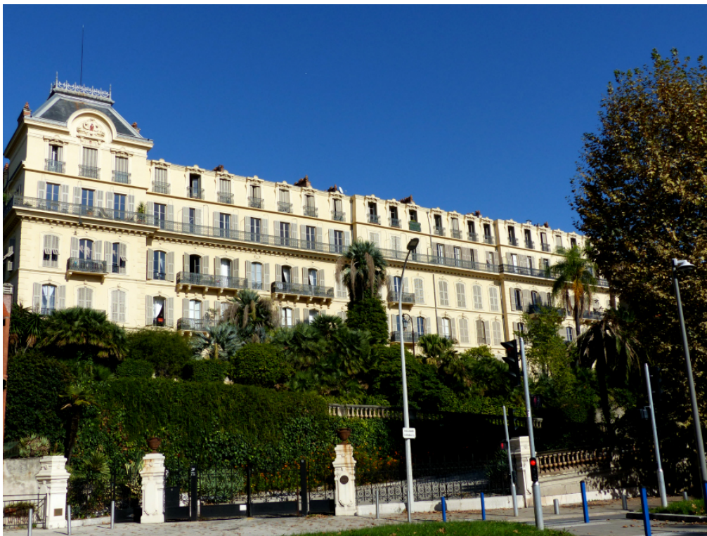
Cliquez sur l'icône pour me retourner .

Il existe plusieurs formes de handicaps. Le centre est adapté à tous les handicaps à l'exception du handicap moteur en raison du caractère historique du bâtiment: il n'est notamment pas équipé de rampes d'accès. Dans ce cas nous vous proposerons des liens avec des partenaires proches ou un Bilan de compétences effectué à distance.